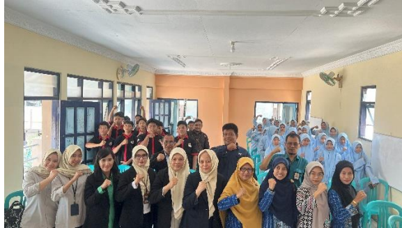
Gambar 1: Tim Pendidik Pelatihan Pendekatan Team Teaching

Kegiatan Pengabdian kepada Masyarakat (PKM) di SMK Muhammadiyah 9 Lamongan berhasil menghasilkan luaran utama yang signifikan, yaitu peningkatan keterampilan komunikasi efektif pada 30 siswa jurusan teknik dan teknologi informasi, pengembangan modul pembelajaran team teaching sebagai produk konkret yang mendukung pembelajaran hybrid , dan peningkatan kapasitas 10 pendidik melalui pelatihan intensif yang berfokus pada strategi pengajaran kolaboratif.