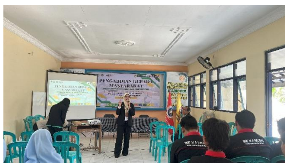
Gambar 2: Tim Pendidik memberikan materi

mengintegrasikan kolaborasi pendidik kejuruan dan bahasa dalam aktivitas berbasis proyek, seperti presentasi proyek kejuruan, diskusi kelompok berbasis studi kasus industri, dan role-playing komunikasi interpersonal. Observasi kelas, mencatat peningkatan partisipasi siswa dalam diskusi kelompok dari rata-rata 3 kontribusi verbal per sesi menjadi 7 ( p < 0,01 ), menunjukkan keterlibatan aktif yang konsisten. Survei self-assessment dengan skala Likert (1-5) mengungkapkan bahwa 93% siswa (28 dari 30) melaporkan peningkatan kepercayaan diri dalam berkomunikasi, naik signifikan dari 47% sebelum kegiatan ( p < 0,01 ), dengan siswa mencatat kemampuan lebih baik dalam menyusun argumen dan menanggapi umpan balik dalam situasi seperti simulasi wawancara kerja. Partisipasi siswa mencapai 100%, dengan semua siswa terlibat aktif dalam aktivitas interaktif, meskipun kegiatan hanya berlangsung satu hari pada 12 Februari 2025 di SMK Muhammadiyah 9 Lamongan, Jalan Raya Mantup No. 99, Lamongan, Jawa Timur. Keberhasilan ini didukung oleh desain pembelajaran yang menyerupai situasi dunia kerja, seperti yang disarankan oleh dan Islam Lamongan & Nur Hasanah, (2023), yang menyatakan bahwa " project-based learning with team teaching significantly enhances communication skills ".